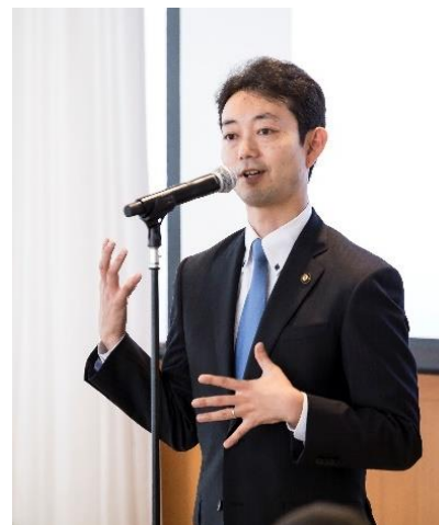
@令和元年度：千葉市

開会のご挨拶を開催地の首長にお願い しています。 実施主体から首長への出席ならびに 挨拶の依頼をお願いします。