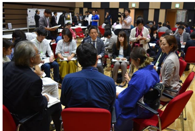
(グループディスカッション：令和1年市川・船橋・浦安)