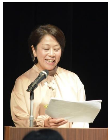
@令和元年度：市川・船橋・浦安

司会は実施主体で担当していただきます。 プロでなくても構いません。 司会原稿は実行委員会で作成し、開催の 1週間前をめぐりにお渡ししています。