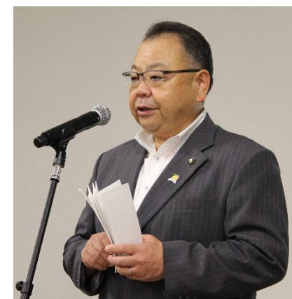
@令和元年度：佐倉市