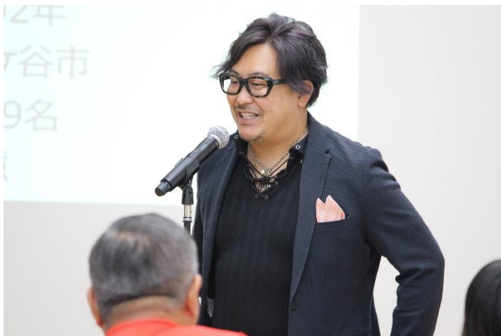
(講演会：令和元年・鎌ヶ谷)

起業家の学びとなるような地域の起業家による講演会やパネルディスカッション、グループディスカッションなどを実施します。