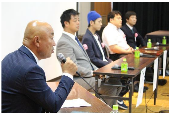
(パネルディスカッション：2018年香取)

実施主体で企画をしていただきます。 地域ニーズに応じた内容を企画して ご提案ください。